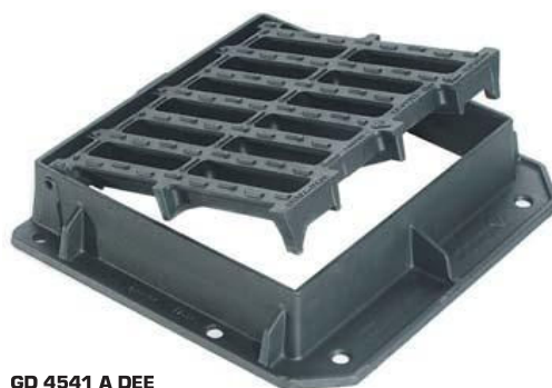
GD 4541 A DEE

Az EN 124 szabvány szerinti 4. súlyterhelési osztály és az alacsonyabb terhelési osztályok.